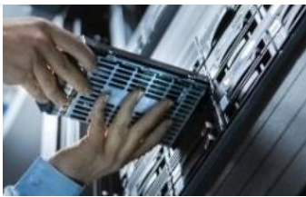
硬件和介质实验室