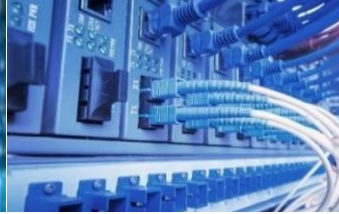
器件和工艺实验室