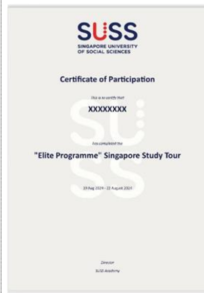
项目结业证书(样例)